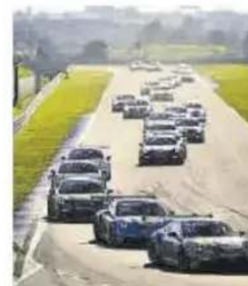
Porsche Sprint Challenge //CIRCUIT

La Porsche Sprint Challenge Southern Europe recala esta semana en el Circuit Ricardo Tormo de Cheste, que celebra su 25 aniversario, con casi 50 pilotos procedentes de media Europa para competir antes del inicio de la temporada de automovilismo. Los participantes están divididos en dos divisiones, cada una con dos categorías. La Sport incluye a los pilotos PRO y PRO-AM que compiten en la Porsche 911 GT3 Cup. En la división Club se reúnen a los pilotos AM en el Porsche 911 GT3 Cup luchando por la victoria general y la clase GT4 para el Porsche 718 Cayman GT4 RS Clubsport y el Porsche 718 Cayman GT4 Clubsport. Hoy y mañana, pruebas libres en pista, y el sábado por la mañana entrenamientos libres y clasificatorios, y las cuatro carreras definitivas entre las 13:00 y las 17:20 horas. Entrada gratuita a la Tribuna de boxes y al paddock para los aficionados.