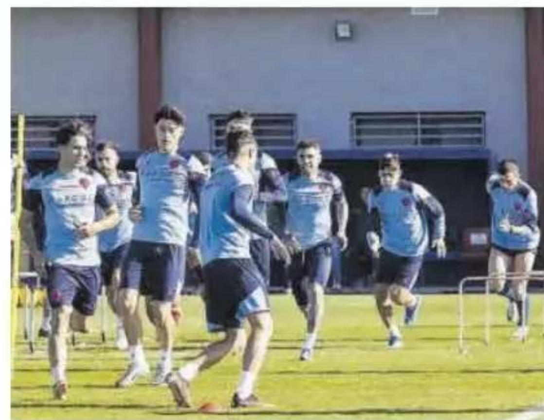
Entrenamiento del Levante.