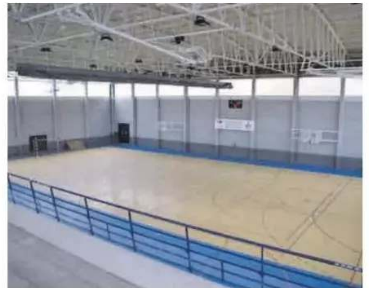
Los municipios apuestan por reformar las instalaciones. //SD

La renovación de instalaciones ya existentes pero obsoletas en algunos casos es preferible, para los ayuntamientos, a la estrategia de optar por la construcción de nuevos recintos, más compleja desde el punto de vista de la inversión financiera. Además, un 59,1% de los municipios consultados sí consideran que necesitan nuevas instalaciones, al contrario que el 40,9%, que considera que no es urgente. De entre las tres provincias, siendo Alicante (78,4%) la provin-