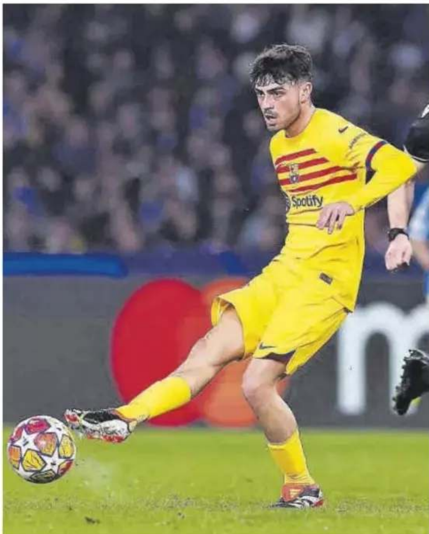
Frenkie de Jong lucha un balón con Iago Aspas

Árbitro: Felix Zwayer (alemán). Mostró tarjetas amarillas a Frenkie de Jong (22') por una falta sobre Di Lorenzo; a Iñigo Martínez (76') por protestar una posible falta en la acción del gol de Osimhen y a Christensen (78') por un agarrón sobre Lobotka.