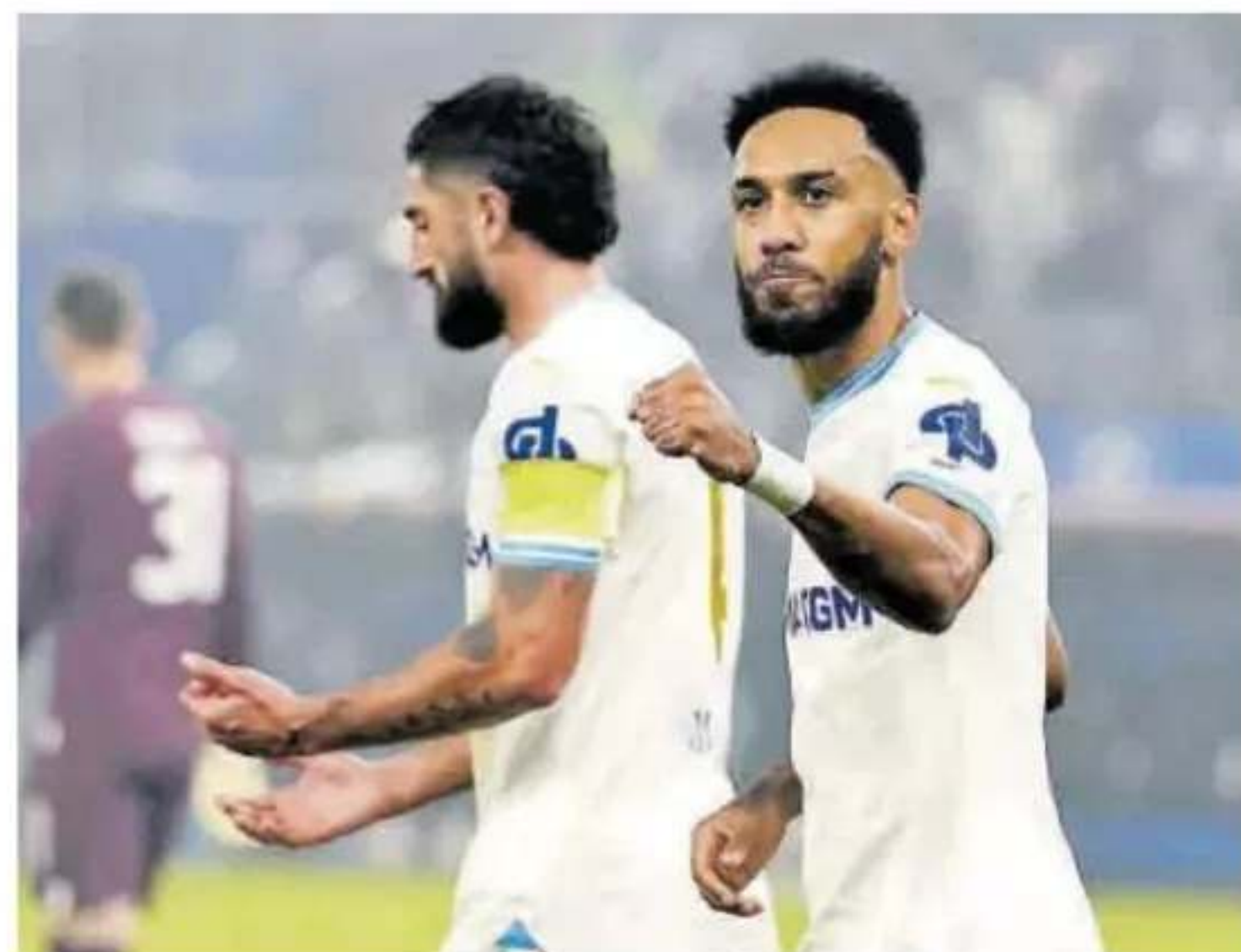
Aubameyang anotó el primero del Marsella en la ida, en un partido que se saldó con un 2-2

Dinamo Zagreb - Real Betis 18.45 h Movistar Plus+ Árbitro: Urs Schnyder (Suiza) Stadion Maksimir