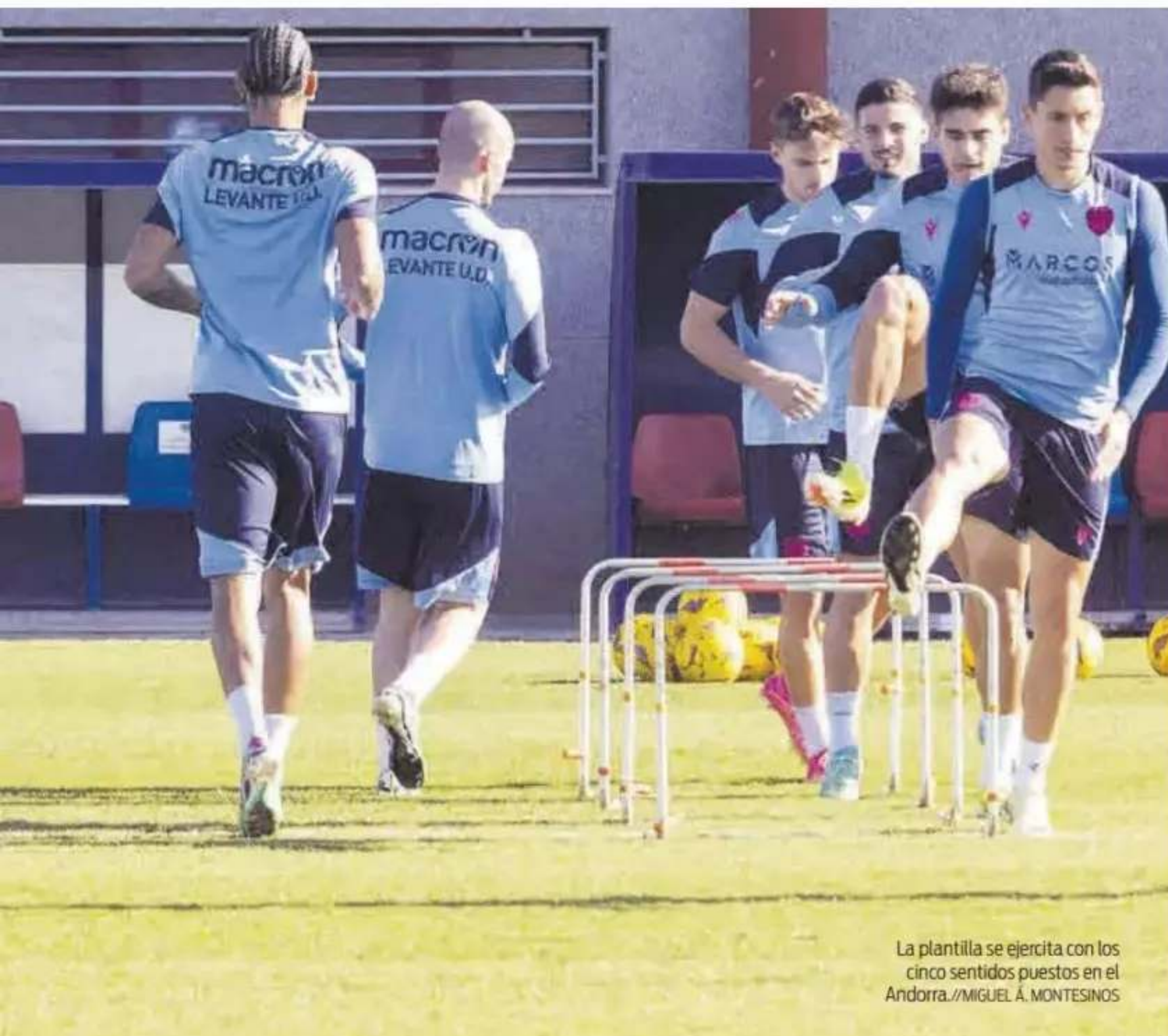
La plantilla se ejercita con los cinco sentidos puestos en el Andorra.