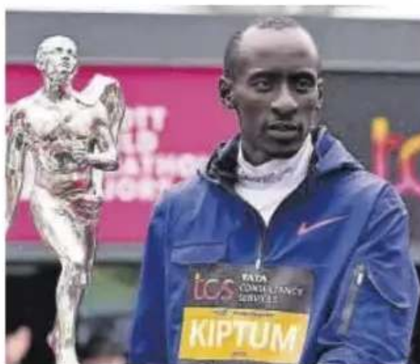
El funeral será un día antes de lo previsto, 23 febrero

El atleta keniano no solo tuvo esas lesiones sino que también, según comentó el patólogo, sufrió lesiones en los pulmones. Sin embargo,