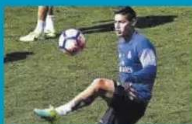
James Rodríguez

El mundo del fútbol nos ha habituado últimamente a pagar cantidades exageradamente altas por futbolistas que en principio no las valen. Seguramente ese fue el caso del séptimo y noveno fichaje más caros de la historia del Real Madrid, James Rodríguez y Luka Jovic. Por el colombiano, los blancos pagaron 75 millones de euros al Mónaco en el verano del 2014 y por el serbio 63 al Eintracht de Frankfurt en 2019. El Mundial del 2014 en Brasil nos dejó a James Rodríguez como el jugador revelación del torneo. Por su parte,