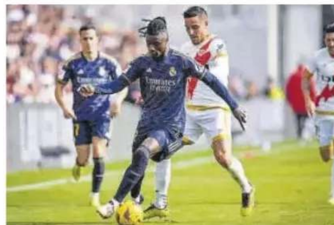
Camavinga obligará a Ancelotti a remodelar la medular

Mbappé fue suplente contra el Nantes, pero marcó su golito