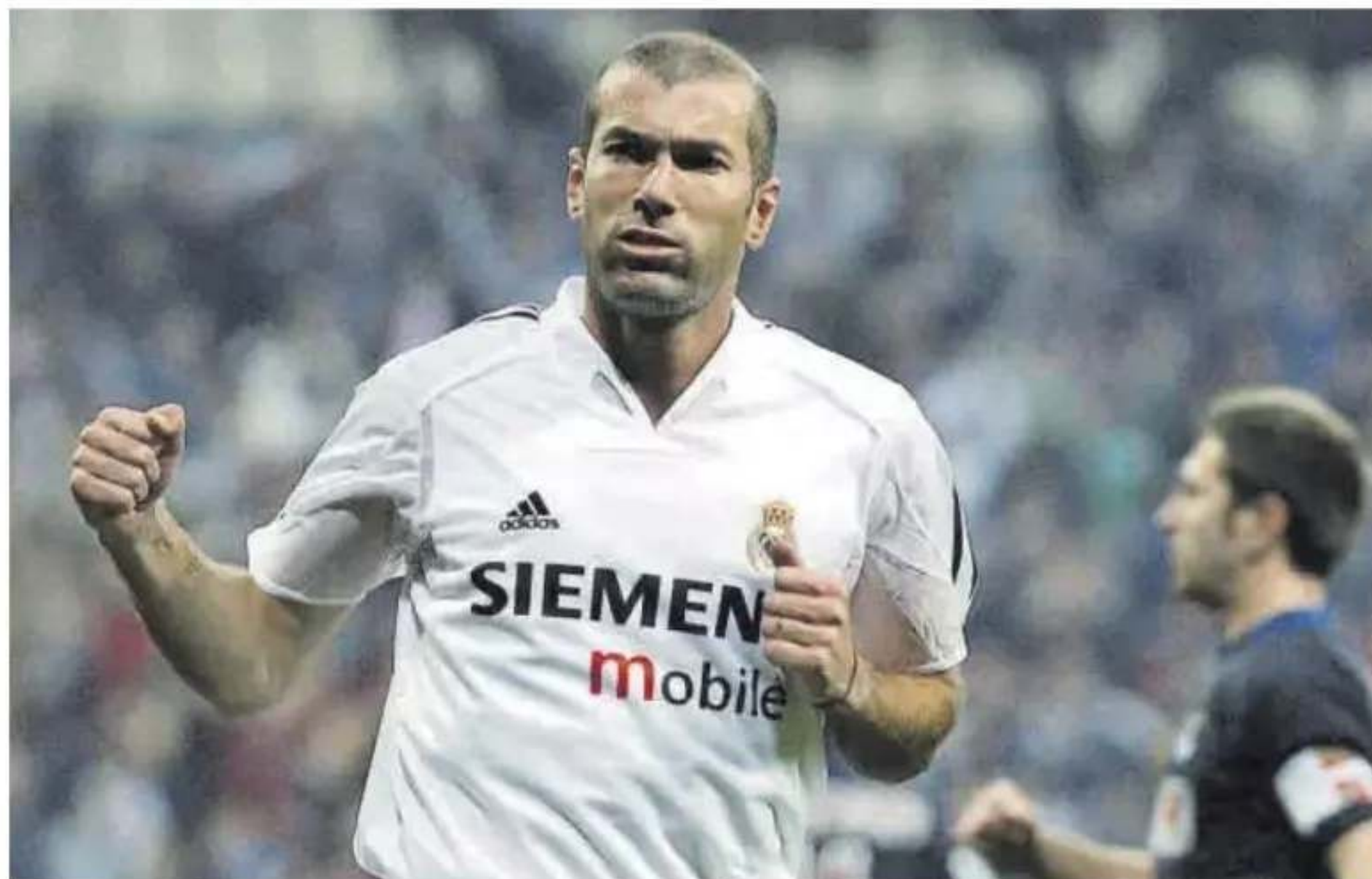
Zinedine Zidane, durante un partido contra la Real Sociedad en 2005

Actualmente, el aún jugador del PSG es uno de los mejores, o el mejor, jugador del mundo. Parece evidente que su llegada al Real Madrid tan solo puede beneficiar deportivamente al club blanco, pero ya ha habi-