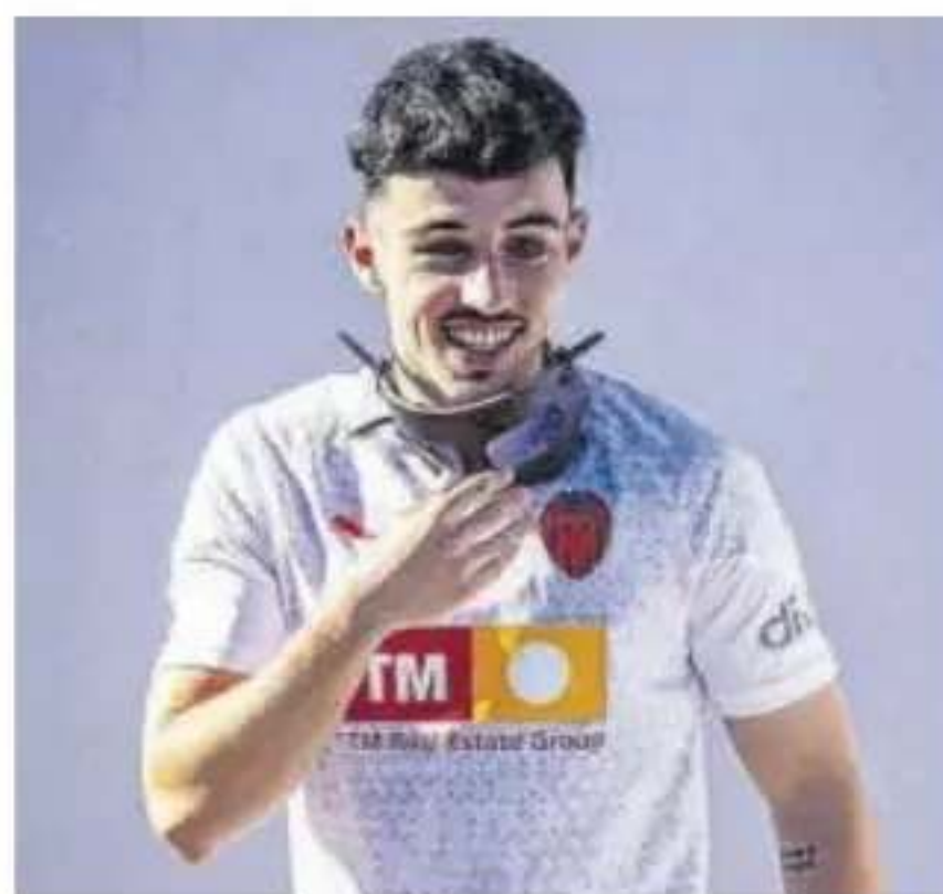
El 'Guajín' se entrena con una máscara protectora.

El asturiano, de 21 años y que sufrió una fractura en el hueso cigomático izquierdo por la que debió ser operado hace 16 días, ya terminó el entrenamiento del martes sin molestia alguna y podría ser la gran novedad de un Valencia que, en su ausencia, no ha sido capaz de marcar ningún tanto. Así, el internacio-