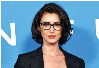
Blanca Romero.