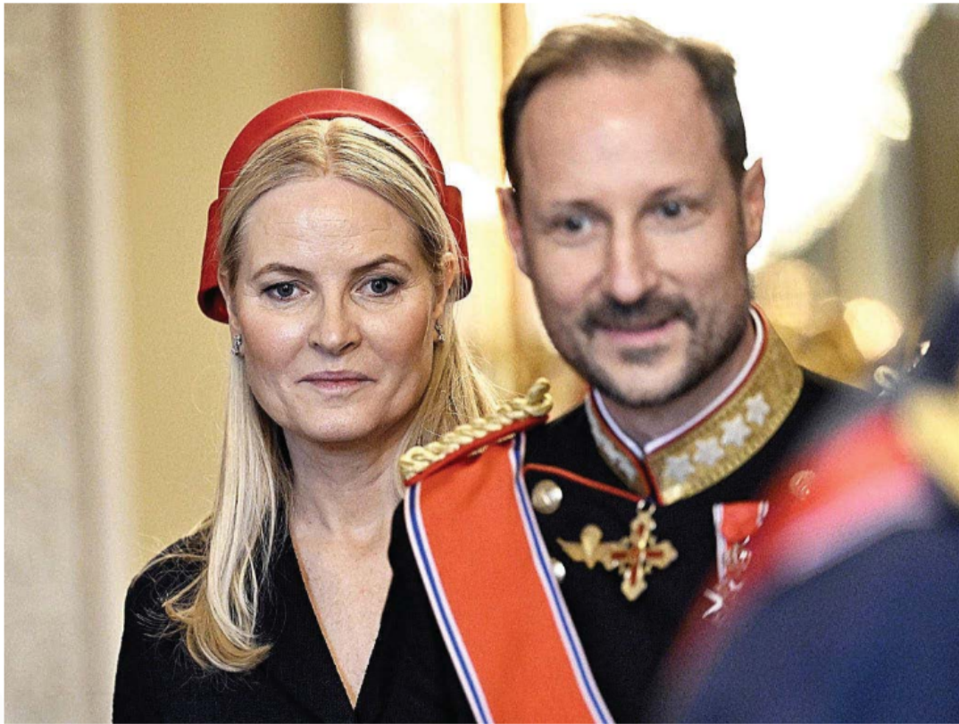
Mette-Marit y Haakon esta semana, durante la recepción a los reyes Matilde y Felipe de Bélgica.