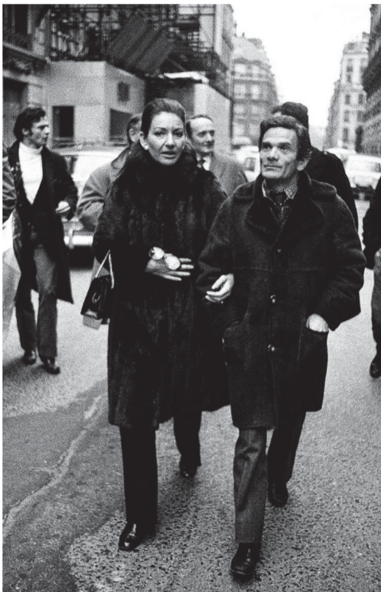
María Callas y Pasolini pasean por las calles de París en los 70.