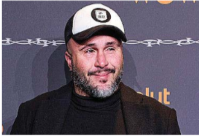
Kiko Rivera.

KIKO RIVERA YA LE CANTA A MAMÁ PANTOJA. Concitando la expectación casi universal, Kiko Rivera, en sus orígenes Paquirrín, ha vuelto al mundo del arte, con una canción dedicada a su madre, o, para ser precisos, "a Mamá". Lejos están los días en que decía que "donde está mejor mi madre es en la cárcel". O cuando en La herencia envenenada de Cantora , la acusó de "dejarle con las dudas" sobre quién era su padre, cuya herencia, por otra parte, reclamaba. El primer vagido de la criatura musical dice que, no importa lo que pase, siempre será su mamá. Lo sospechábamos desde que anunciaron su reconciliación. No sería raro que, previo pago de su importe, se reconciliaran del todo. A Isa Pi, ni agua.