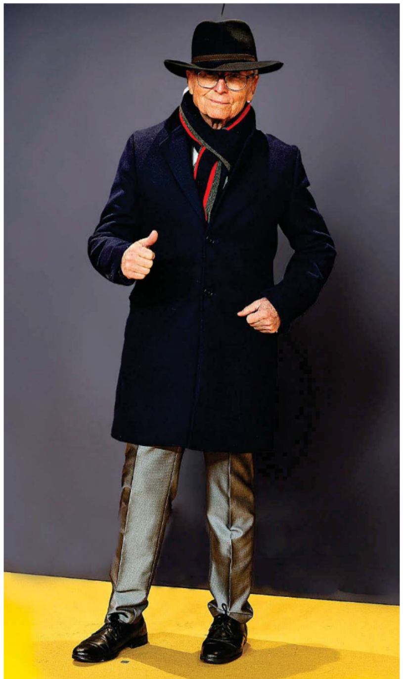
José Ortega Cano en el 'photocall' de la feria de San Isidro, el pasado febrero.

Sostenidas por un público fiel, pero en general pasadas de moda, esas mujeres seguían recibiendo mucha atención de la prensa