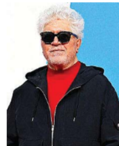
Pedro Almodóvar.