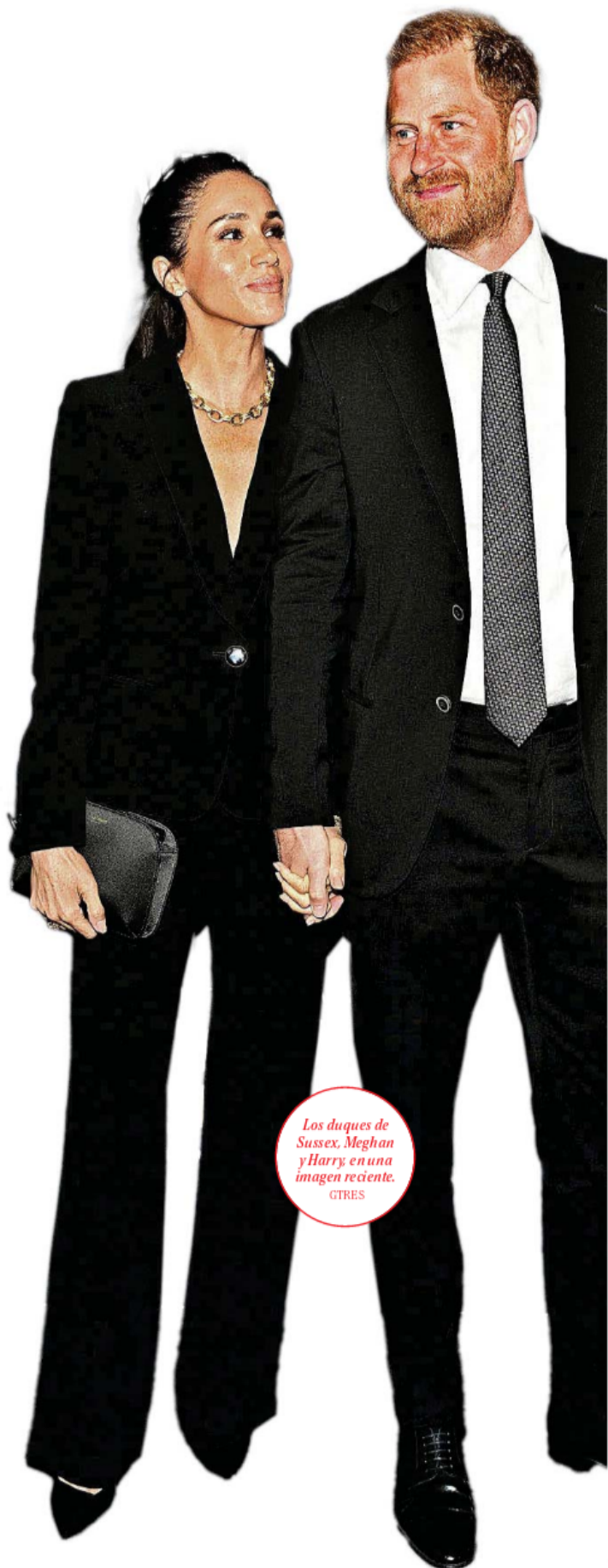
Los duques de Sussex, Meghan y Harry en una imagen reciente.