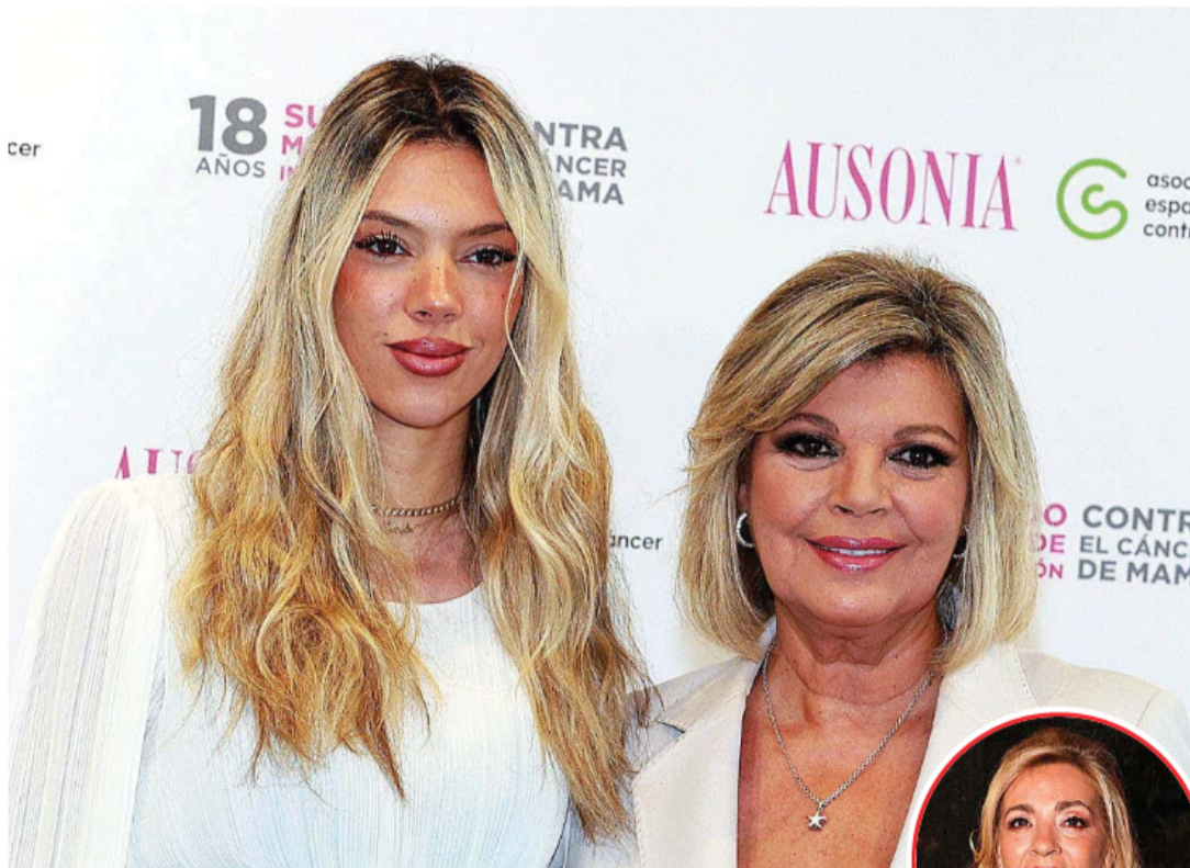
Alejandra Rubio junto a su madre, Terelu Campos, en un 'photocall' en octubre de 2025.