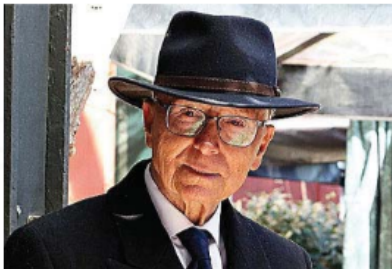
José Ortega Cano.