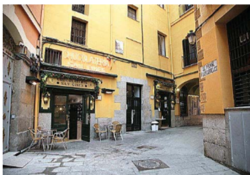
La mítica chocolatería San Ginés, al lado de la Joy Eslava. J. BARBANCHO

zando el chocolate con churros. Soy de los que creen que en nuestra gastronomía hay cuatro pilares fundamentales: el jamón, la paella, la tortilla y por qué no, los churros con chocolate".