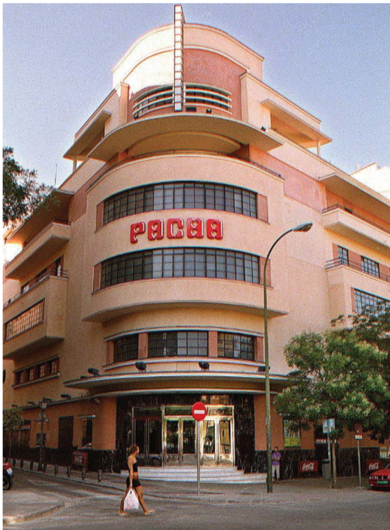
La discoteca Pachá en 2003. El edificio está catalogado como monumento de interés cultural.

Posteriormente, el mayor obstáculo era Martín Castaño, un guar-